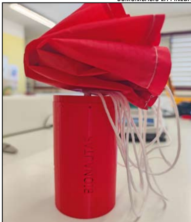
COMUNICACIÓ LA PINEDA

Hi participen dos grups del centre: BIO-