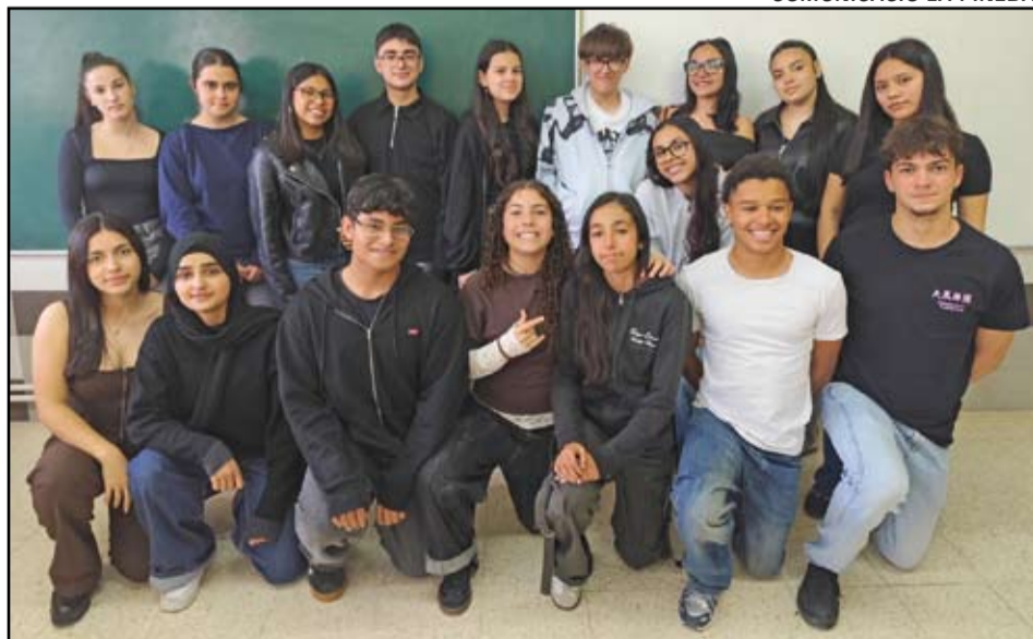
COMUNICACIÓ LA PINEDA