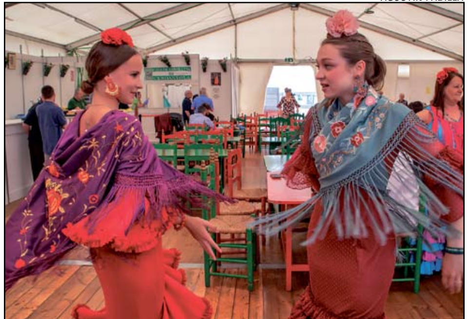
Fotografia ganadora del concurso del año pasado en la categoría de Feria de Abril.