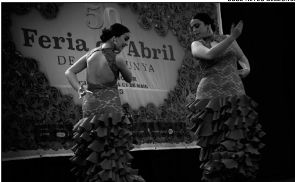
Primer premio especial Feria de Abril catalana, "Feria de Abril" de José reyes Belzunce.